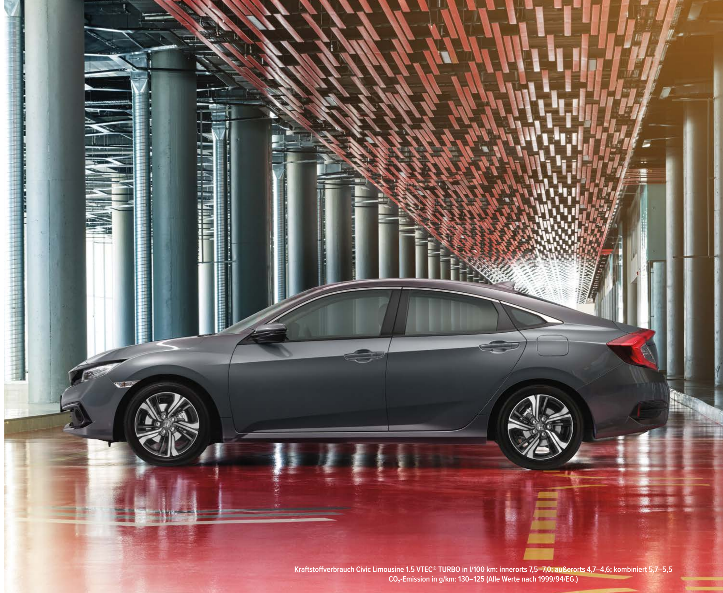
Abbildung zeigt Civic Limousine 1.5 VTEC® TURBO Executive in Polished Metal Metallic.

Kraftstoffverbrauch Civic Limousine 1.5 VTEC® TURBO in l/100 km: innerorts 7,5–7,0; außerorts 4,7–4,6; kombiniert 5,7–5,5 CO 2 -Emission in g/km: 130–125 (Alle Werte nach 1999/94/EG.)