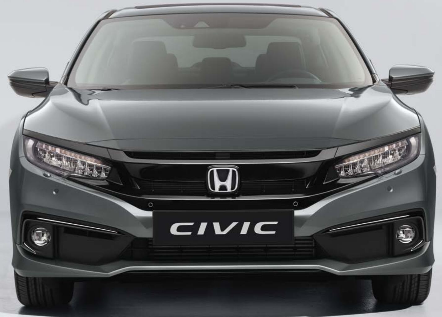
Abbildung zeigt Civic Limousine 1.5 VTEC® TURBO Executive in Polished Metal Metallic.

Das Druckverlustwarnsystem DWS (Deflation Warning System) überwacht den Reifendruck und alarmiert Sie, wenn ein Reifen möglicherweise beschädigt ist bzw. der Luftdruck absinkt.