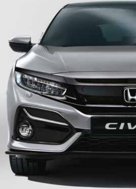
LUNAR SILVER METALLIC