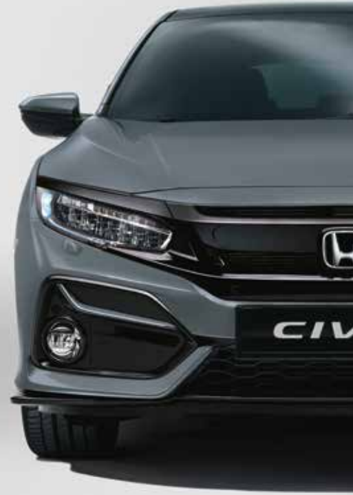
SONIC GREY PEARL