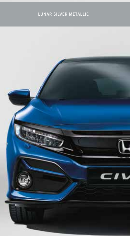
BRILLIANT SPORTY BLUE METALLIC