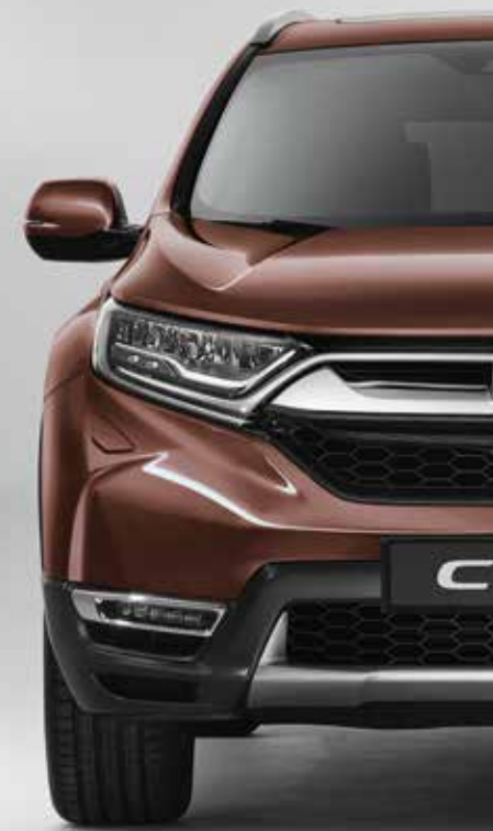
AGATE BROWN PEARL