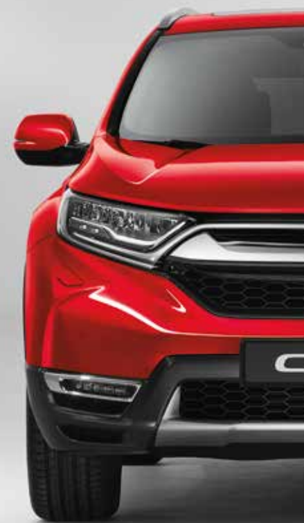
RALLYE RED 2)