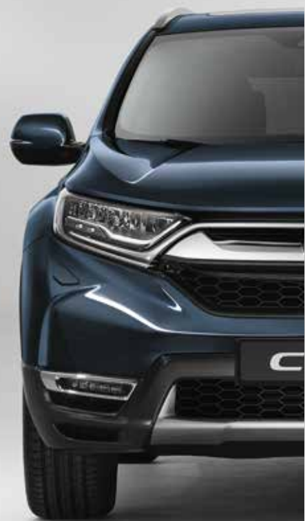
COSMIC BLUE METALLIC