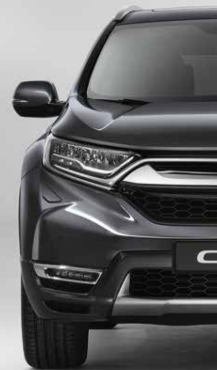
MODERN STEEL METALLIC