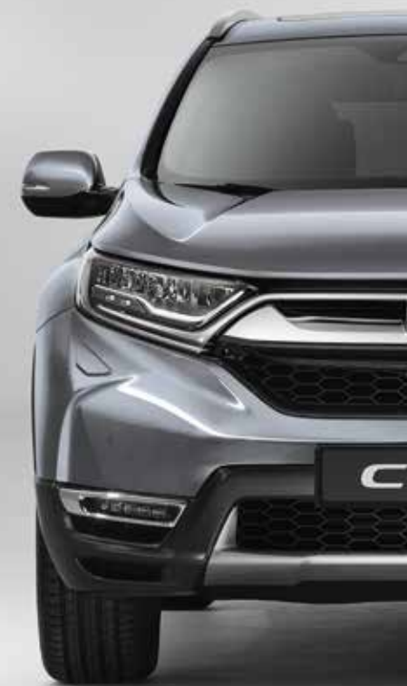
LUNAR SILVER METALLIC