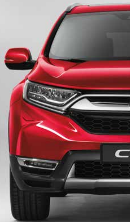
PREMIUM CRYSTAL RED METALLIC 1)

Jede Farbe wurde kreiert, um das Styling des CR-V Hybrid perfekt zu ergänzen. Sie müssen nur Ihren Favoriten auswählen.