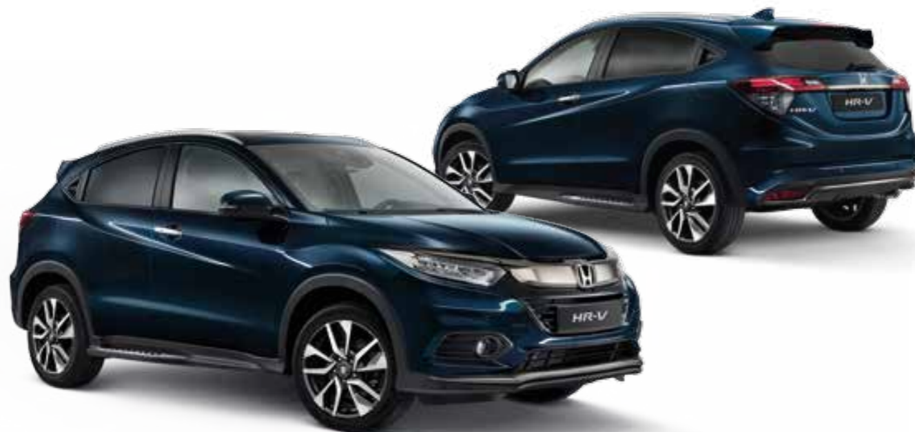
Abb. zeigen 18-Zoll-Leichtmetallfelgen HR1804.

Das Paket beinhaltet: Unterfahrschutz vorne und hinten, schwarz pulverbeschichtete Seitentrittbretter, „Black Edition“-Fußmatten, Kofferraummatte, „Black Edition“-Emblem in Schwarzchrom-Optik an der Heckklappe. Optional können Außenspiegelverkleidungen und Radbefestigungsmuttern in Schwarz sowie die passenden 18 Zoll Komplettträger HR1804 mitbestellt werden.