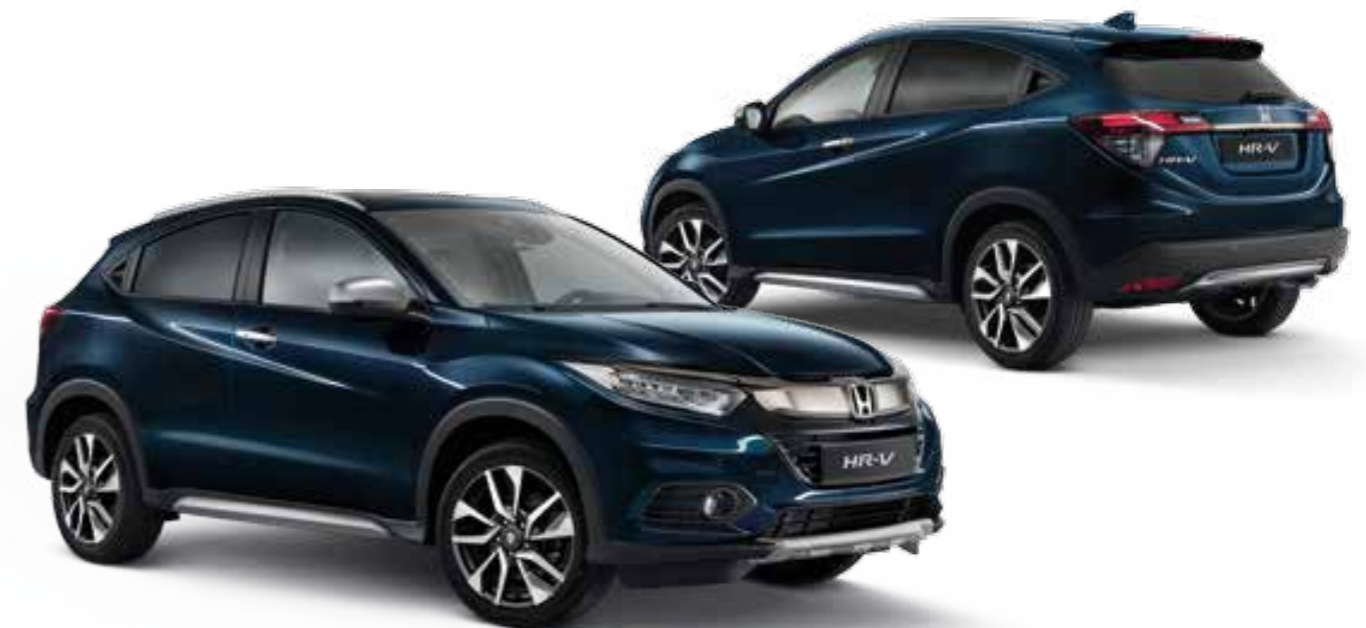
Abb. zeigen 18-Zoll-Leichtmetallfelgen HR1803.

Das Paket beinhaltet: Aero-Sportstoßfänger vorne und hinten, Dachspoiler in Wagenfarbe lackiert sowie Seitentrittbretter.