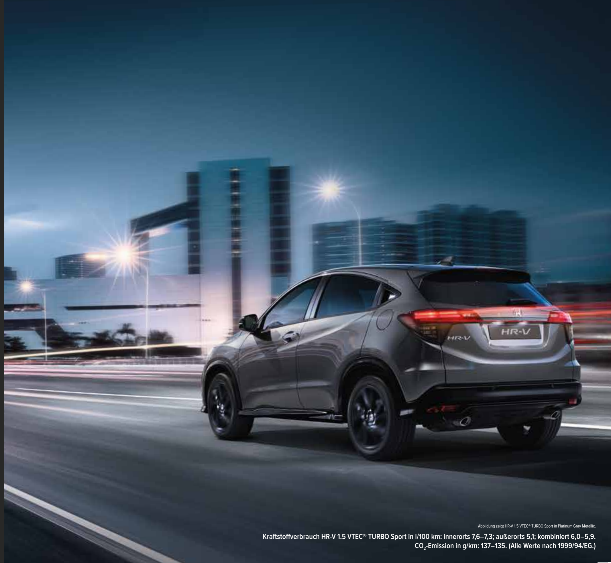
Abbildung zeigt HR-V 1.5 VTEC® TURBO Sport in Platinum Gray Metallic.

Die dazu passende Motorisierung mit dem 1.5 VTEC® TURBO mit 182 PS (134 kW) ist äußerst durchzugsstark. Freuen Sie sich auf den Rausch der Beschleunigung, die Sie in den Sitz presst. Zusätzlich tragen fortschrittliche Technologien wie Agile Handling Assist, Performance-Stoßdämpfer und variable Übersetzungsverhältnisse zum sportlichen und dynamischen Fahrgefühl bei.