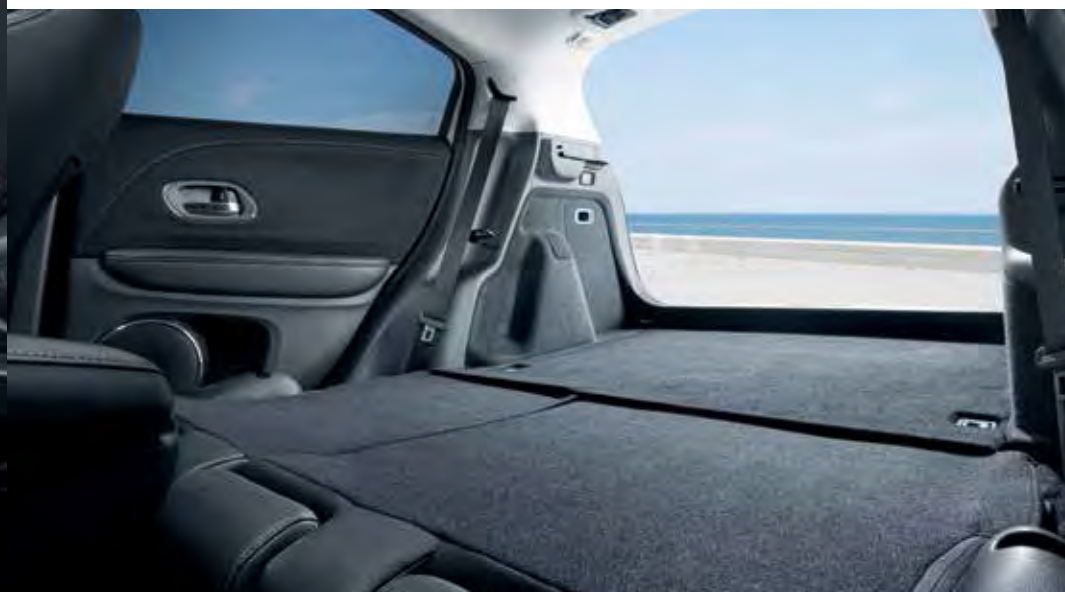
Abbildung zeigt HR-V 1.5 i-VTEC® Executive in Midnight Blue Beam Metallic.

** Nur für die Ausstattungsvariante Executive erhältlich