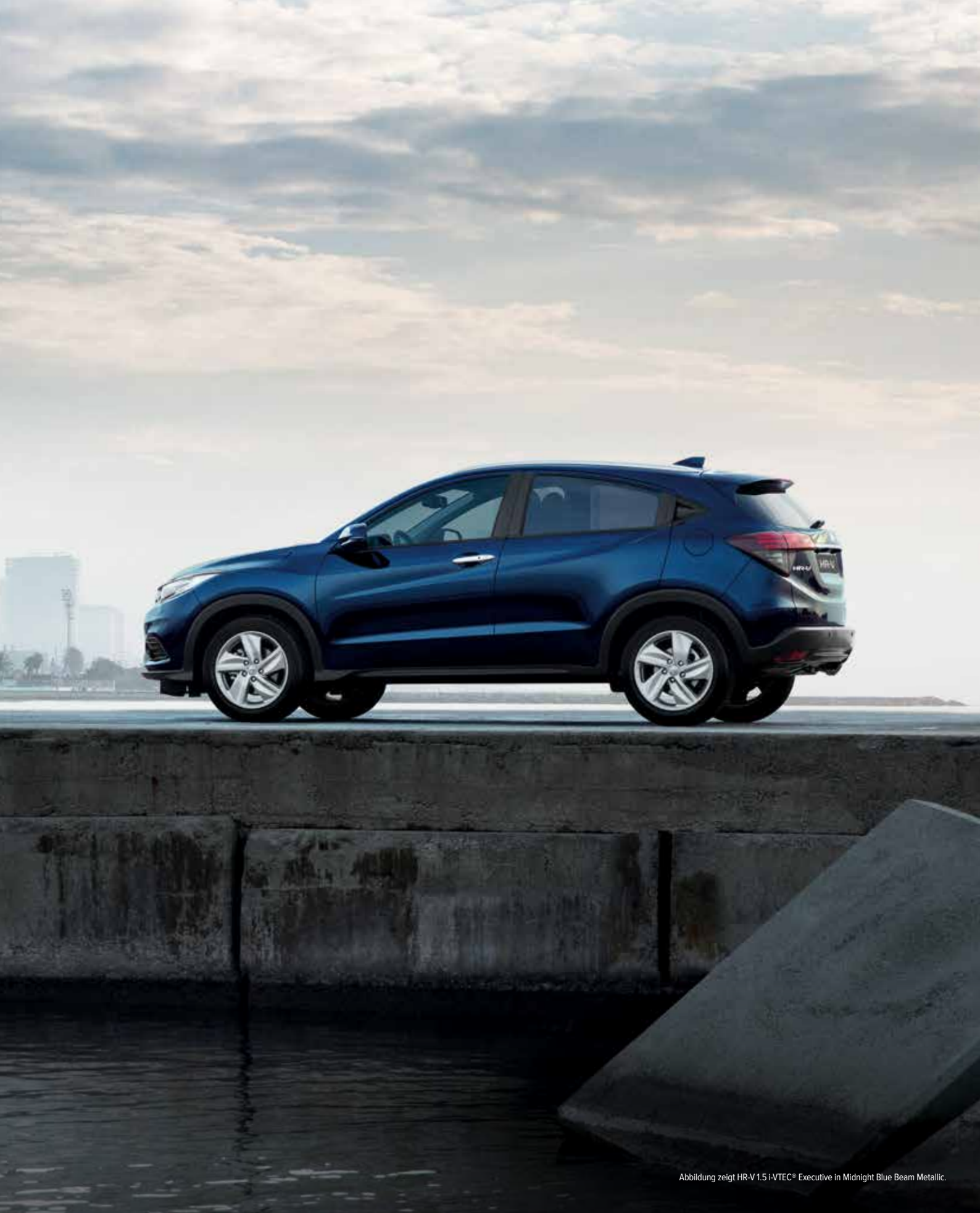
Abbildung zeigt HR-V 1.5 i-VTEC® Executive in Midnight Blue Beam Metallic.